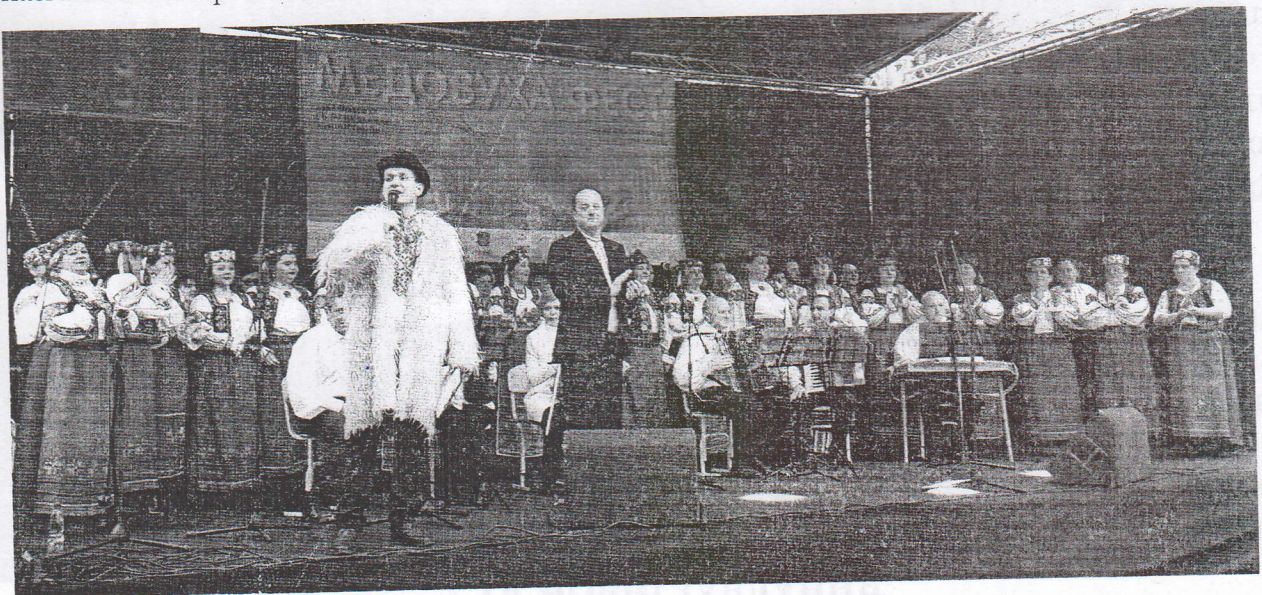
Народний аматорський ансамбль пісні і танцю «Дружба»

Протягом п'яти годин гості дійства насолоджувалися чудовими виступами аматорських колективів Ужгородського міського центру дозвілля – будинку культури, Ужгородського коледжу культури і мистецтв , Ужгородського музичного коледжу