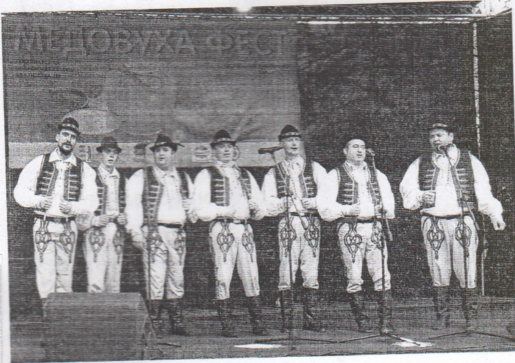
Народний аматорський вокальний ансамбль «Бетяри»

17 лютого на набережній Незалежності в місті Ужгород було людяно та весело, медові напої своїм п'янким ароматом з самого ранку запрошували містян та гостей долучитися до найсолодшого, найкориснішого найдухмянішого фестивалю-ярмарку «Медовуха Фест». Упродовж двох днів у кожного відвідувача буде можливість у гастрономічній локації провести час смачно, ситно і корисно, а біля сцени – цікаво, весело і колоритно!