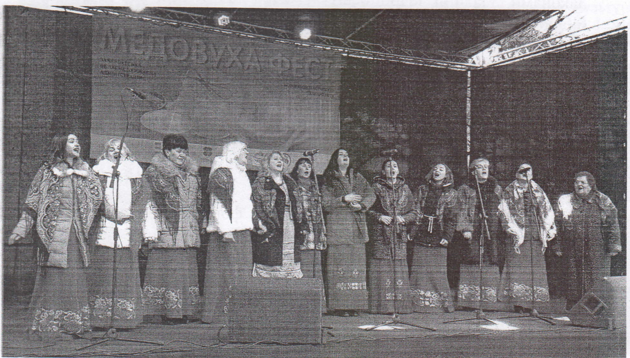
Народний аматорський вокальний ансамбль «Ужанка»