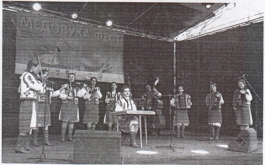
Народний аматорський фольклорний ансамбль народних інструментів «Маки»